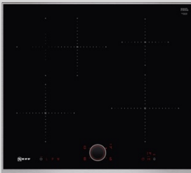
T46TS61N0 N 90 Induktionskochfeld 60 cm, Schwarz