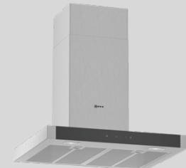
D65BHM4N0 N 50 Wandesse Box-Design 60 cm, Edelstahl