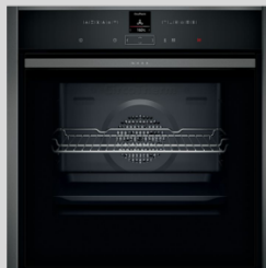
B57CR22G0 N 70 Einbau-Backofen 60 cm, Graphite-Grey