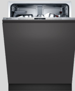
S255EB800E N 50 Geschirrspüler XXL 60 cm, vollintegrierbar