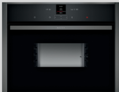
C17DR00G0 N 70 Einbau-Dampfgarer 45 cm, Graphite-Grey