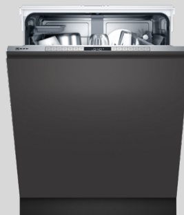
S155HAX29E N 50 Geschirrspüler 60 cm, vollintegrierbar