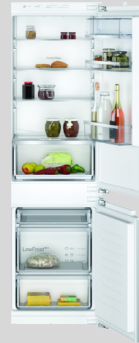
KI5862FE0 N 50 Einbau Kühl-Gefrier-Kombination mit Gefrierfach unten, 177,2 x 54,1 cm