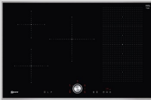
T58TT20N0 N 70 Induktionskochfeld 80 cm, Schwarz