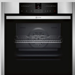
B45VR22N0 N 70 Einbau-Backofen mit VarioSteam® Dampfunterstützung 60 cm, Edelstahl