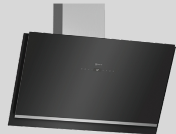
D95IKP1S0 N 70 Schrägese 90 cm, Klarglas schwarz bedruckt