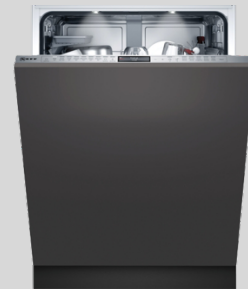
S299YB800E N 90 Geschirrspüler XXL 60 cm, vollintegrierbar