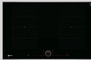
T68TS6RNO N 90 Induktionskochfeld 80 cm, Schwarz