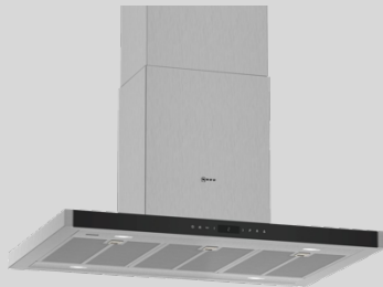
I96BMV5N5 N 90 Inselhaube Box-Design 90 cm, Edelstahl