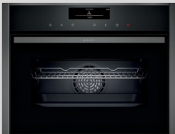
C18FT28G0 N 90 Kompakt-Dampfbackofen 60 cm, Graphite-Grey