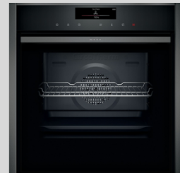
B58VT68G0 N 90 Einbau-Backofen mit VarioSteam® Dampfunterstützung 60 cm, Graphite-Grey