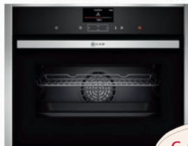
Compact- Dampfbackofen CFS1742NMC