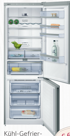
Kühl-Gefrier- kombination KSN945A3MC