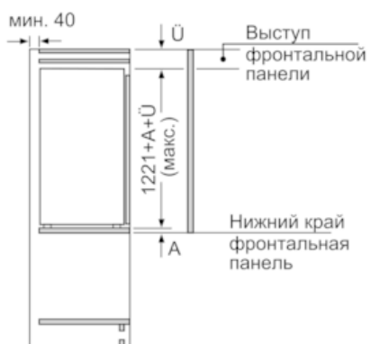
Размеры в мм