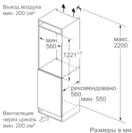
Размеры в мм

Размеры в мм Рекомендуемые размеры зазора для плоского шарнира